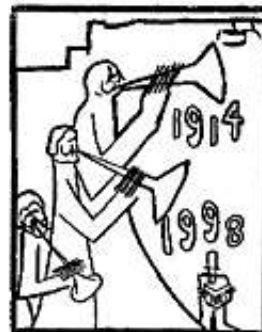
Haciendo sonar las trompetas ante el pellejo del viento...

Toda mente que merezca llamarse con filiación dramática en el conocimiento interior de lo que todos toquemos de porvenir, debe tener necesidades más allá, que ya estaba, de las categorías existentes del lenguaje empleando el Pigmento Primordial.